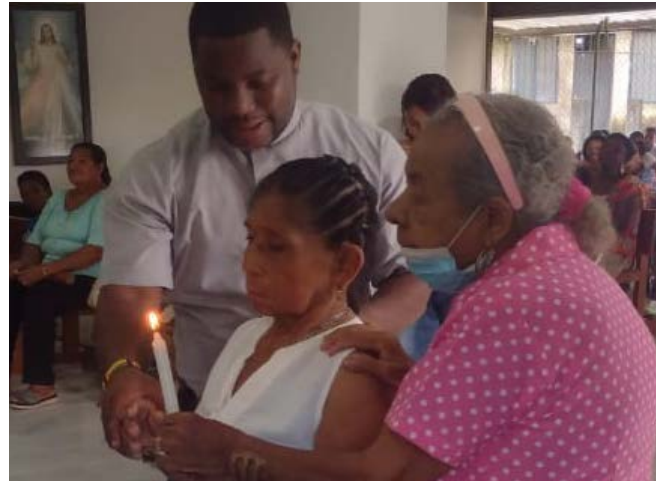
BUENAVENTURA BAUTISMO PARA ADULTOS

Desde la virtualidad hasta la presencia del Milagro de Buga. La Pastoral Afro Cali culminó sus 40 días de peregrinación con eucaristías virtuales diarias. Celebraron este momento con miles de peregrinos en Buga.