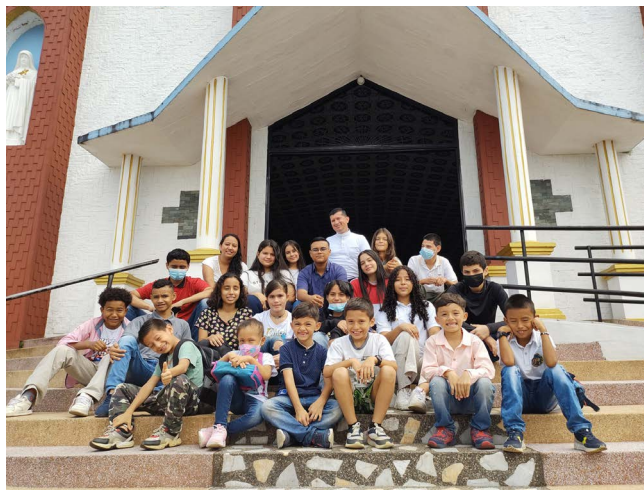
FLORENCIA - CAQUETÁ NIÑOS MISIONEROS

Grupos de Infancia y juventud Misionera de la comunidad parroquial Corazón Inmaculado de María del barrio el Torasso. “De los Niños del Mundo Siempre Amigos.