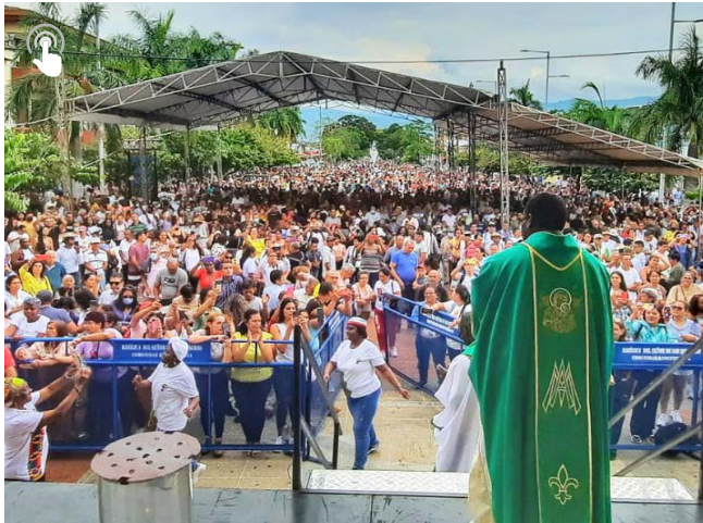
CALI PEREGRINACIÓN 40 DÍAS

Desde la virtualidad hasta la presencia del Milagro de Buga. La Pastoral Afro Cali culminó sus 40 días de peregrinación con eucaristías virtuales diarias. Celebraron este momento con miles de peregrinos en Buga.