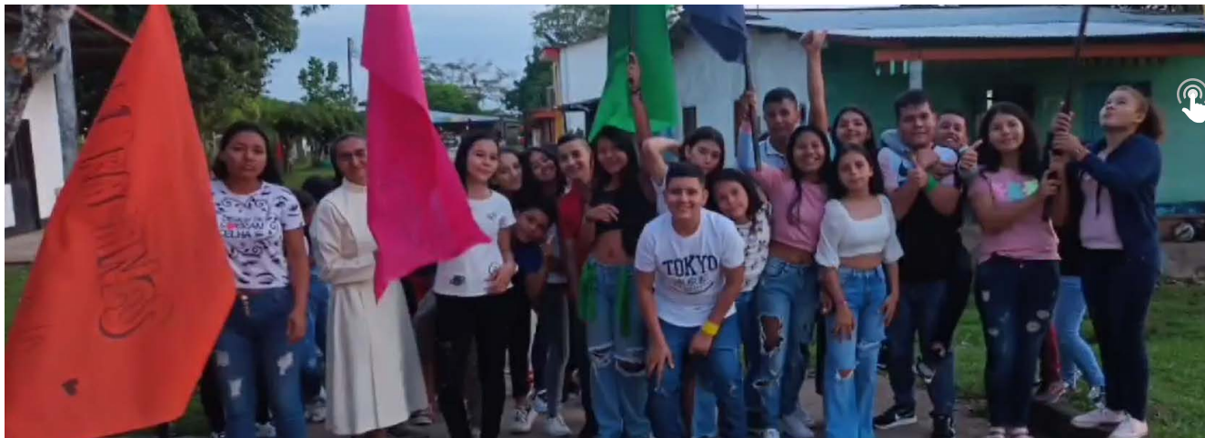
SOLANO RETIRO JUVENIL

Compartimos algunos momentos del primer día del retiro juvenil, el cual llevaba como lema “Jóvenes con identidad en Cristo”, en esta jornada se reflexionó sobre el ¿quién soy? ¿hacia dónde se dirige mi vida? y ¿quién o qué influye en ella?