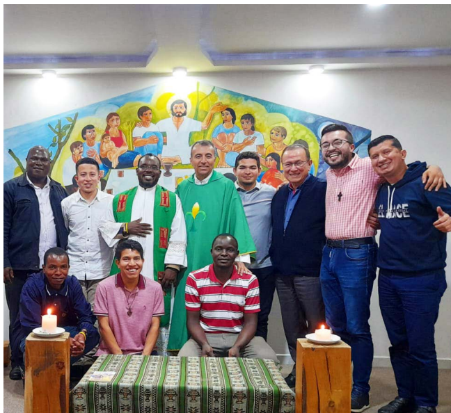
BOGOTÁ - CIUDAD JARDÍN VISITA A LA CASA FILOSOFICA