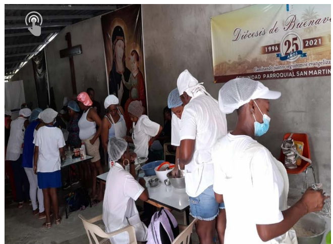
BUENAVENTURA FORMACIÓN EN COMUNIDAD

Desde tempranas horas la comunidad parte a rezar el rosario de aurora, sobre todo, los sábados, en memoria de la Santísima Virgen María.